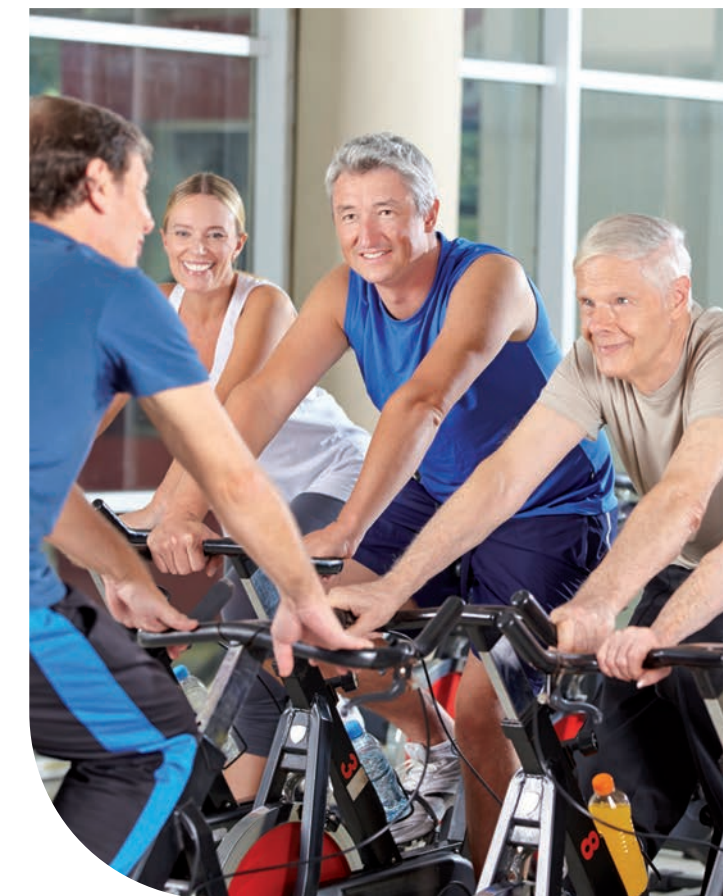
Titelbild © Robert Kneschke - fotolia.com, Texte: Dr. phil. Oliver Göhl